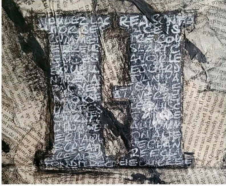
POINTS DE SUSPENSION • 142 x 116cm • VAL D'OFF 2021